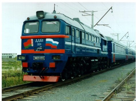
... а также проезд и сигареты

«В сложившихся условиях концерном вынужденно предприняты меры для защиты белорусского рынка нефтепродуктов и уменьшения диспаритета цен со странами-соседями»