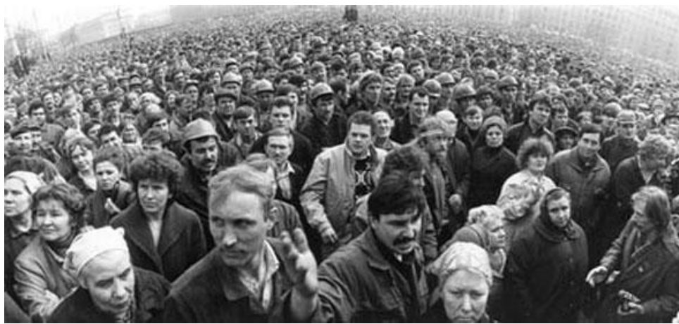
Масавы мітынг працоўных на плошчы Леніна 10 красавіка 1991 года..

Бухвостаў: “Так, учора была інфармацыя пра тое, што на «Трактарным заводзе» ўзніклі хваляванні ў цэхах, і крыніцы пацвердзілі, што гэта сапраўды ёсць. Я не бачу тут незвычайнасці, бо абвал, які адбыўся ў эканоміцы, балюча ўдарыў па працоўных і, натуральна, працоўныя будуць выказваць прэтэнзіі. Іншая