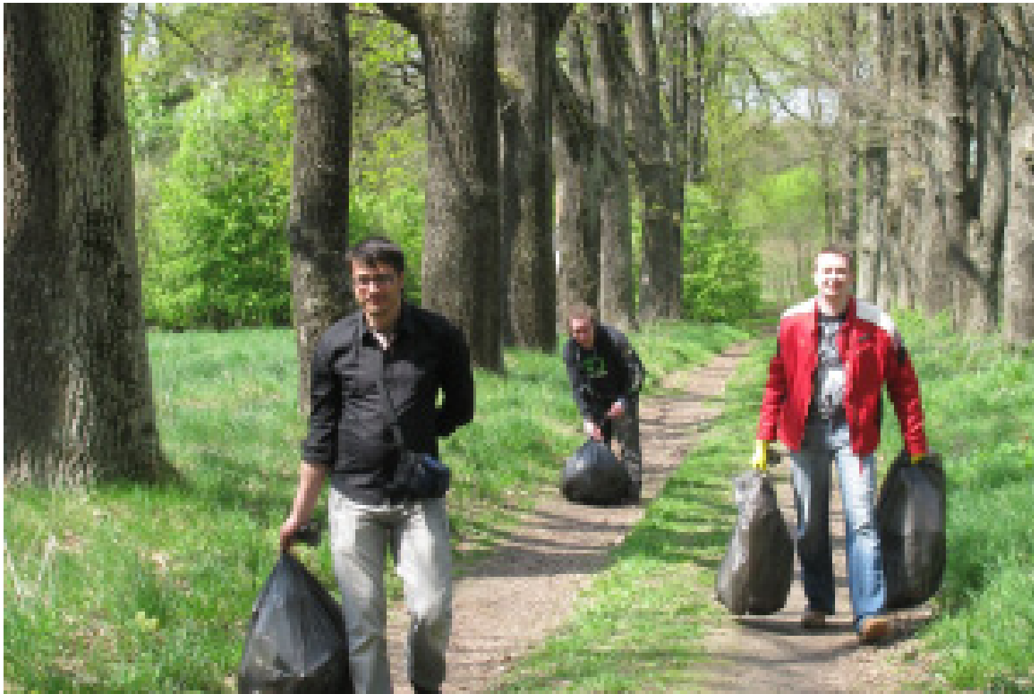
ШЫПЯНСКІ ПАРК. ГРАМАДСКАЯ ІНІЦЫЯТЫВА "ЗА НОВЫЯ СМАЛЯВІЧЫ"