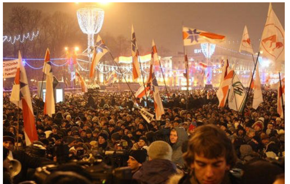
19 снежня 2010

Калі яна бяздзейнічае, яна робіцца дэструктыўнай для грамадства. ●