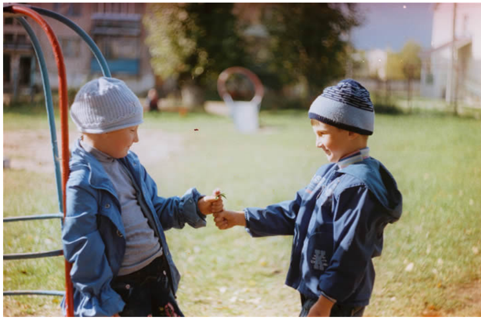
Імгненні вясны ў Смалявічах.

ПОЛУЧИВ МЕХАНИЧЕСКИЕ повреждения, указанная автомашина была остановлена вблизи деревни Быкачено Смолевичского района. Как оказалось 49-летний водитель находился в состоянии алкогольного опьянения (2,04 промилле). В отношении правонарушителя составлены административные протоколы.