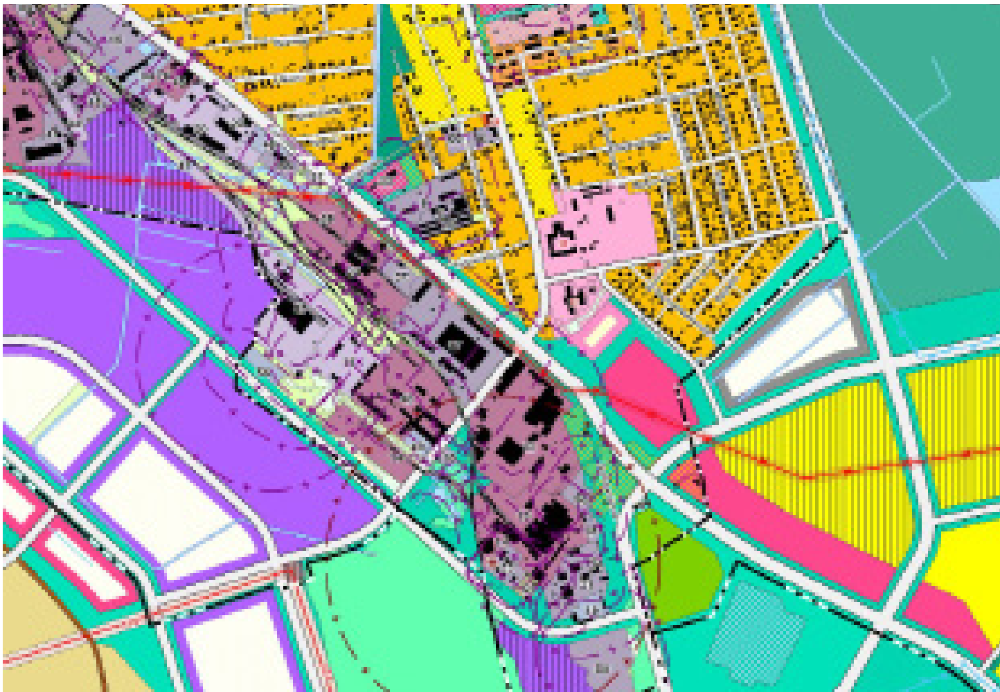
НОВЫ ГЕНПЛАН СМАЛЯВІЧАЎ