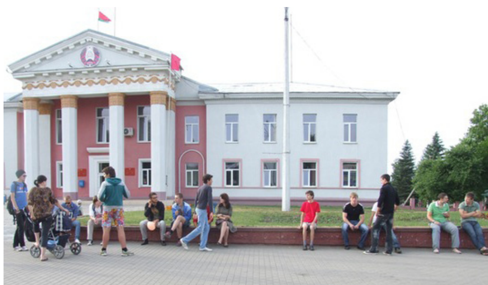
На акцыі 15 чэрвеня сабралася некалькі дзесяткаў чалавек.