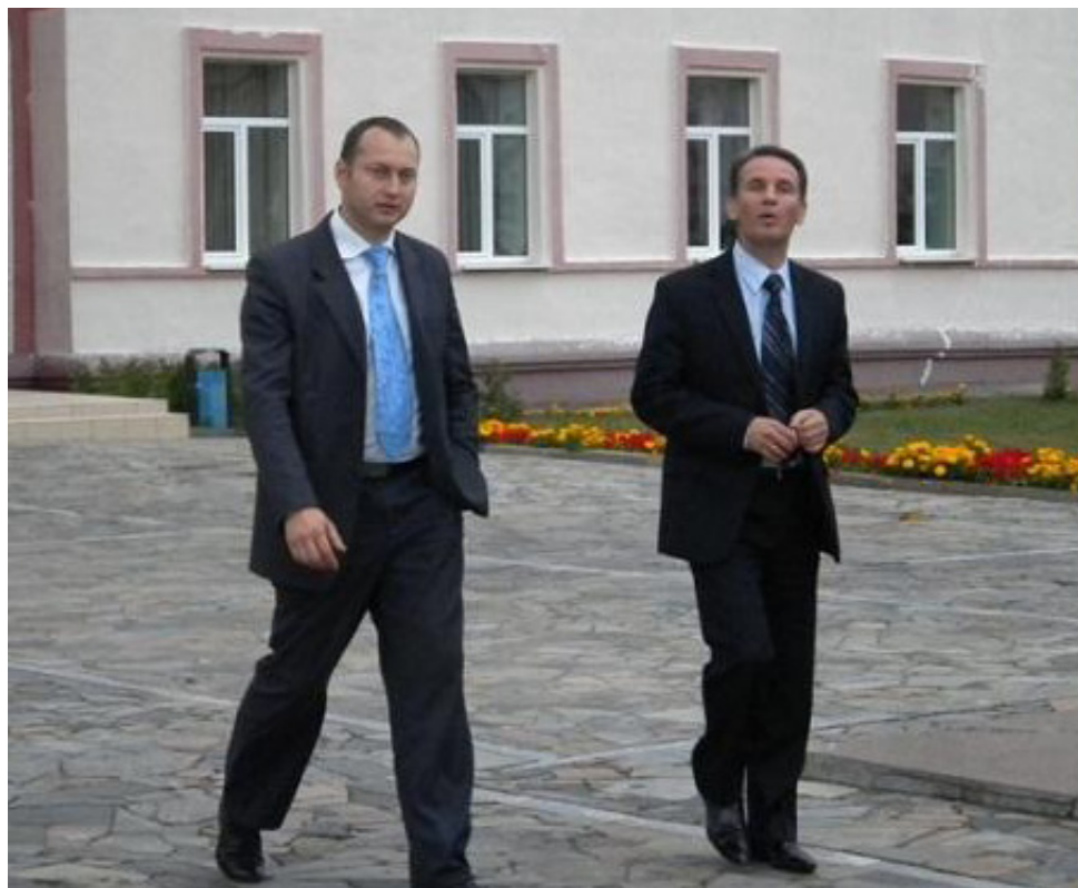
29 чэрвеня супрацоўнікі выканкама былі заклапочаны і не дазвалялі рабіць фотаздымкі.