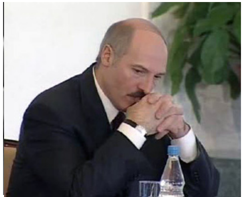
Лічба гатовых зноў прагаласаваць за Лукашэнку 29,3%